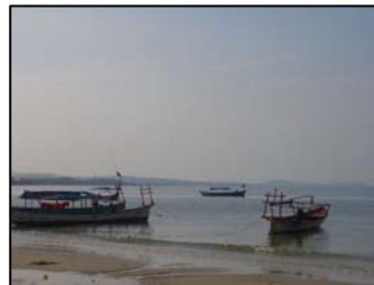
La plage de Sianoukville et ses bateaux de pêcheurs, aux aurores